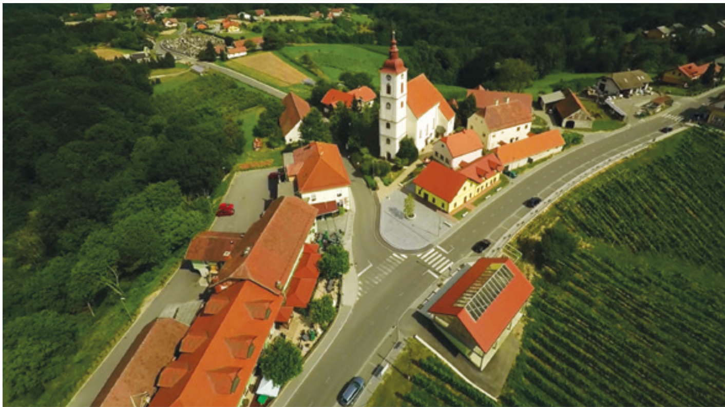
V ponedeljek, 8. oktobra 2018, je Turistična zveza Slovenije na slavnostni prireditvi v Portorožu podelila priznanje Občini Sveta Ana za doseženo 1. mesto v kategoriji trška jedra v okviru projekta Moja dežela – lepa in gostoljubna 2018 , ki se je odvijala pod pokroviteljstvom predsednika RS Boruta Pahorja.