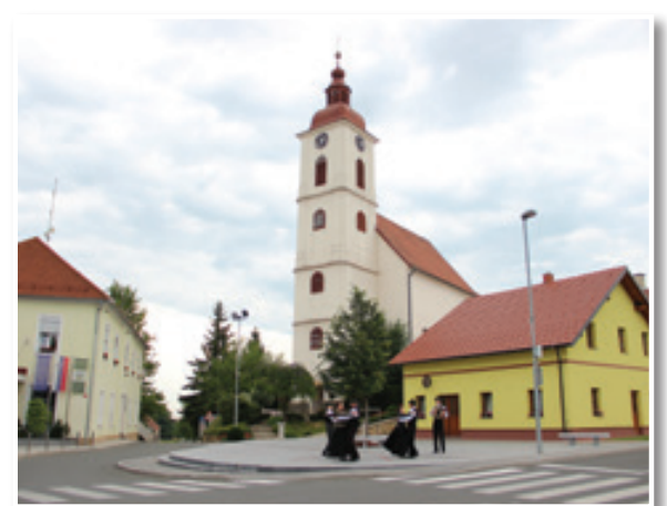
Trško jedro Sv. Ane - priljubljen prireditveni prostor