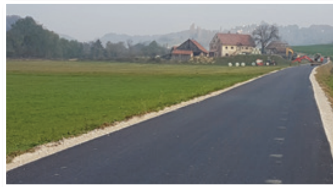
Zadnja dela na cesti Malna-Plodršnica